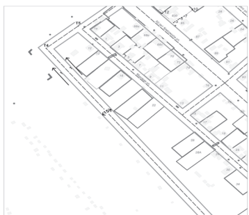
Разбивочный чертёж красных линий в кварталах № 475; 673; 408