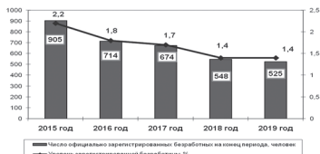
Число зарегистрированных безработных граждан

Среднемесячная заработная плата работников организаций Белогорска (без учета субъектов малого предпринимательства) в январе-декабре 2019 года составила 50 274 рубля, 102,5 % в сопоставимых ценах (с учетом роста цен на товары и услуги) к 2018 году. Среднемесячное значение показателя за январь-декабрь 2019 года - 55 966 рублей.